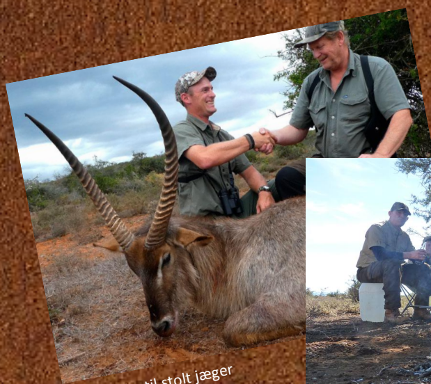
Tillykke til stolt jæger