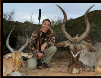
Impala (handyr) + Kudu (handyr)

Bemærk at reguleringsjagt (af hensyn til vildt forvaltningen), kun tilbydes på forespørgsel og i visse perioder af sæsonen.