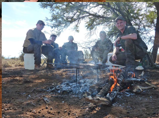
Frokost i jagt terrænet