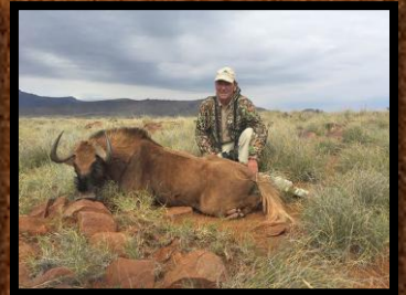
Black Wildebeest (hundyr)