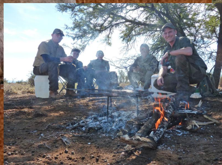
Frokost i jagt terrænet