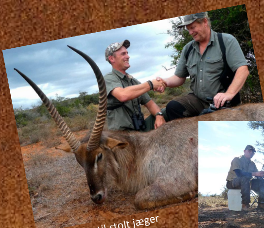
Tillykke til stolt jæger