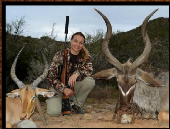
Impala (handyr) + Kudu (handyr)

Bemærk at reguleringsjagt (af hensyn til vildt forvaltningen), kun tilbydes på forespørgsel og i visse perioder af sæsonen.