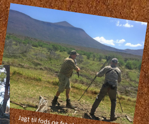
Jagt til fods og fra skydestok