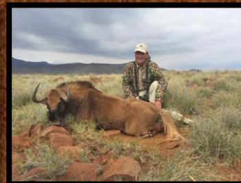
Black Wildebeest (hundyr)