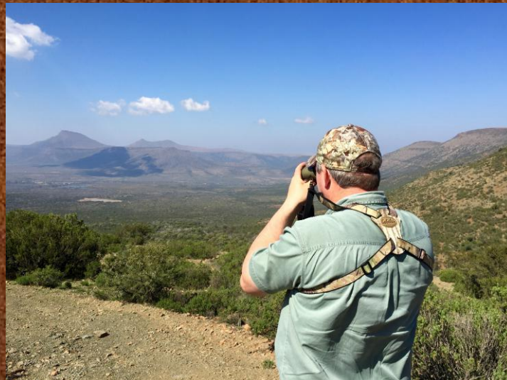
Vildtet spottes fra højdedrag og pürsches efterfølgende

Bæredygtighed er naturligvis vigtigt for os og vi tilbyder derfor både trofæ og reguleringsjagt. Trofæjagten foregår på de gamle handyr og grundet vildtets optimale levevilkår og en stram afskydningspolitik, vil du opleve meget stærke trofæer, som i langt de fleste tilfælde ligger i medaljeklassen.